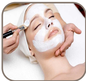
Soins du Visage