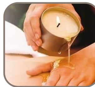
Massage à la Bougie

Evadez vous avec un gommage rose litchi, suivi d'un modelage doux et relaxant pour vous offrir un moment hors du temps